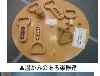
▲温かみのある楽器達

【生徒】 Q今年の注目点は？ A木工芸品や家具、福祉玩具。 Qお客さんの入りや反応は？ Aおぼろげ。(二十四日現在)来場者は九十六人で、その中には就職先の企業の人達も多く来場しました。 Q校外展示について一言。 A一般の人達にもインテリア科の活動を見てもらえると嬉しい機会だと思います。 【井口先生】 Q今年の展示物の出来は？ A例年より仕上げがよい家具など、カラフルになっていて良くなってきている。 Q生徒に一言。 Aできるだけの経験を将来に役立てて、いろいろなことにチャレンジしてほしい。