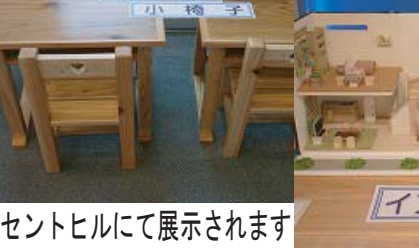
▲セントヒルにて展示されます

【生徒】 Q今年の注目点は？ A木工芸品や家具、福祉玩具。 Qお客さんの入りや反応は？ Aおぼろげ。(二十四日現在)来場者は九十六人で、その中には就職先の企業の人達も多く来場しました。 Q校外展示について一言。 A一般の人達にもインテリア科の活動を見てもらえると嬉しい機会だと思います。 【井口先生】 Q今年の展示物の出来は？ A例年より仕上げがよい家具など、カラフルになっていて良くなってきている。 Q生徒に一言。 Aできるだけの経験を将来に役立てて、いろいろなことにチャレンジしてほしい。