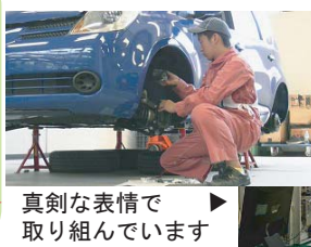
真剣な表情で取り組んでいます