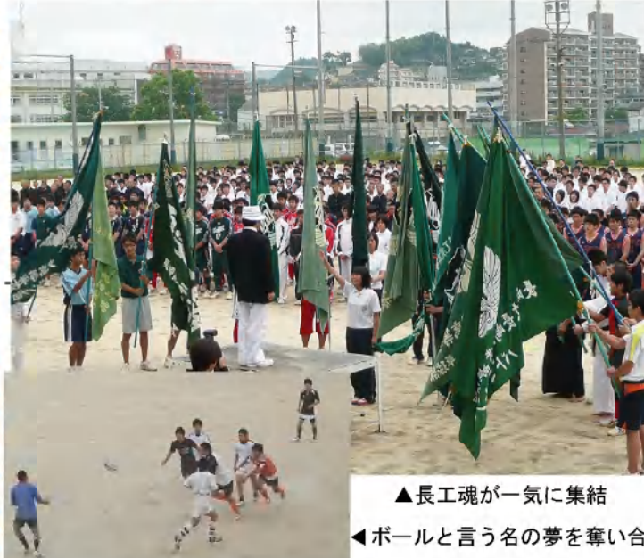
▲長工魂が一気に集結 ◀ボールと言う名の夢を奪い合え！

「水泳部」 ①皆で声を出して励まし合う。 ②他の学校の速い人。 ③一人でも多くインターハイに行き、高総体では総合三位以内入賞。 ④アクエリアス一人一Lとクエン酸1kg ⑤瓊浦高校。 ⑥ベストの更新。 ⑦山田君 水着姿で 泳いで