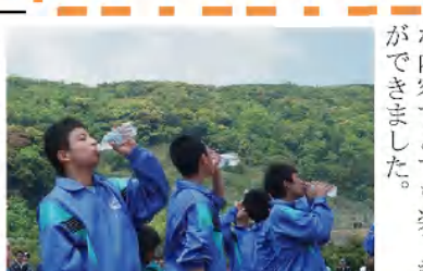
▲さすが 男の飲みっぷり!